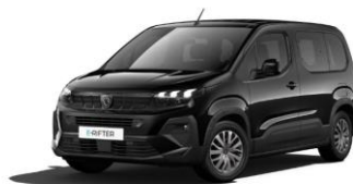
9VM0 - CRNA PERLA NERA