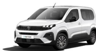
PRP0 - BIJELA ICY