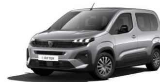
F4M0 - SIVA ARTENSE