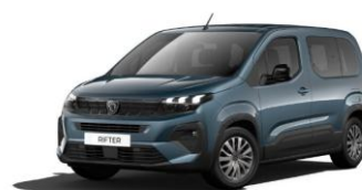
M6M0 - PLAVA KIAMA