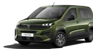
4QM0 - ZELENA SIRKKA