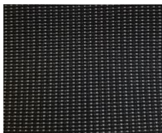
CMFY - Tkanina "Curitiba"

• = Unutrašnjost u seriji o = Unutrašnjost u opciji