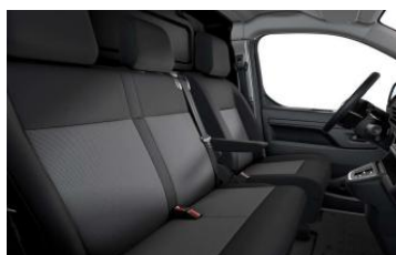
CMFT - Unutrašnjost od tkanine Curtiba Meltem

• = Unutrašnjost u seriji o = Unutrašnjost u opciji