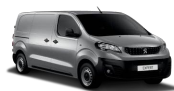
F4M0 - Siva Artense