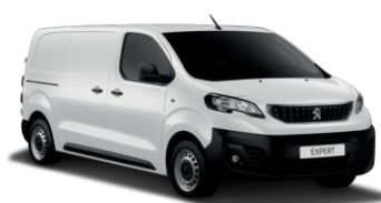
PRP0 - Bijela Icy