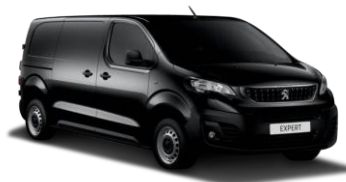
9VM0 - Crna Perla Nera